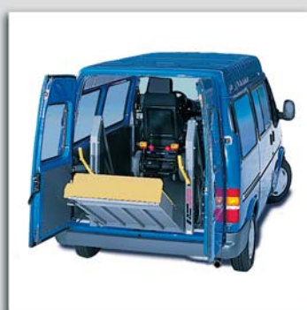
ist Ein- oder Aussteigen...