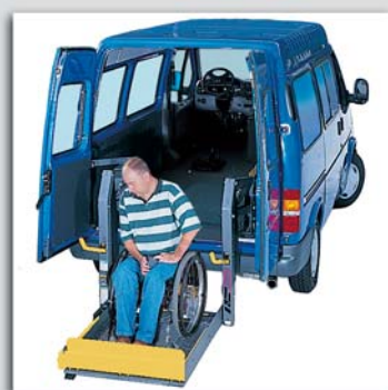
In wenigen Sekunden...

Dieser vollautomatische Rollstuhllifter ist mit seinen beiden Handgriffen ideal für Rollstuhlfahrer. Die zusätzliche innere Abdeckplatte garantiert hohe Sicherheit beim Hochfahren der Hebebühne, da die Füße nicht zwischen Lifter und Stoßstange eingeklemmt werden können.