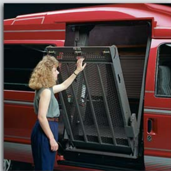
Manuelles Einklappen der Plattform erfordert nur geringen Kraftaufwand.

Alle Lifter sind mit einer Abrollsicherung ausgestattet.