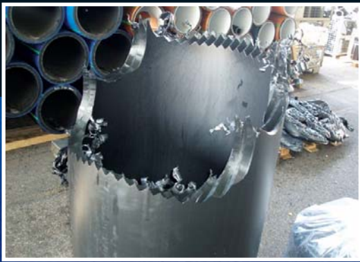
Beispiel: dickwandiges PE Rohr