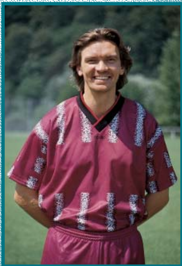
Paul Steiner 349 Bundesliga-Spiele Waldhof Mannheim MSV Duisburg 1. FC Köln Weltmeister 1990